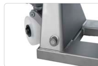
Stor drejevinkel på 220°