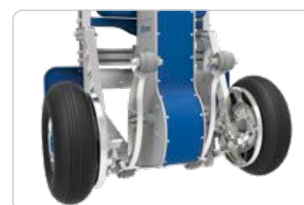
Monteret med bremse