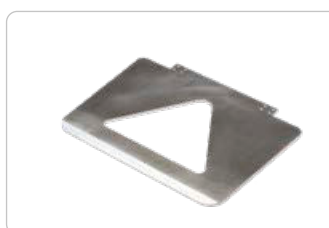
Stor lasteflade str. 48 x 34 cm Varenr.: 8573130