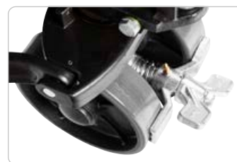
Bremse Varenr.: 8524800